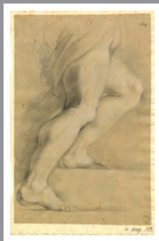
III/Abb: studio di gamba, XVII secolo | Beinstudie, 17. Jh., Erdmannsdorff- Nachlass, Anhaltische Gemäldegalerie Dessau, Graphische Sammlung